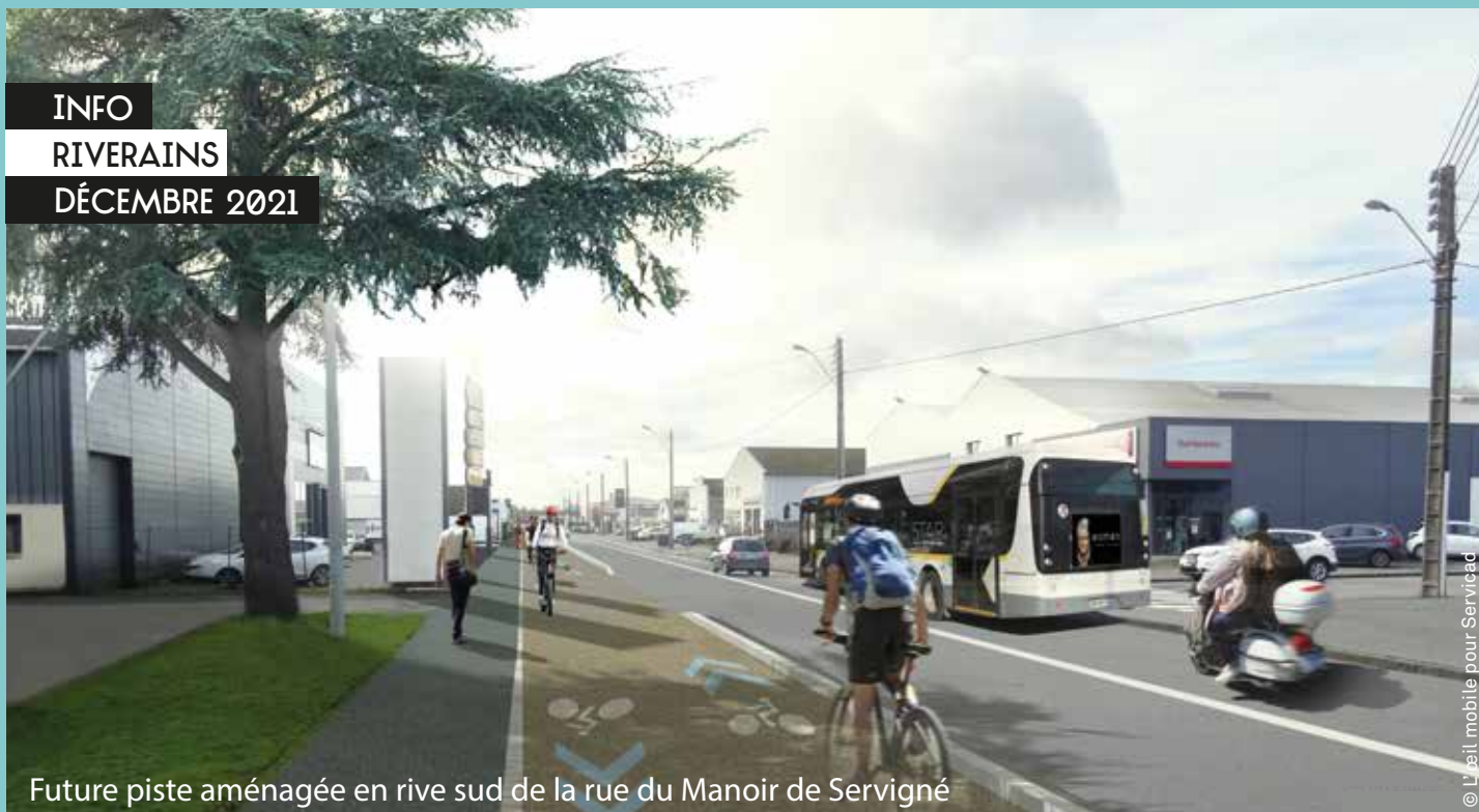
Future piste aménagée en rive sud de la rue du Manoir de Servigné