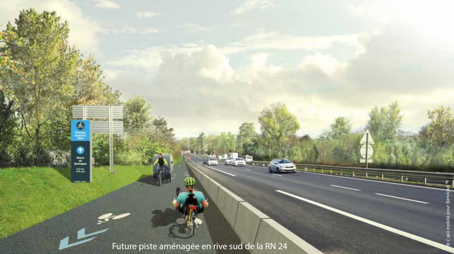
Future piste aménagée en rive sud de la RN 24