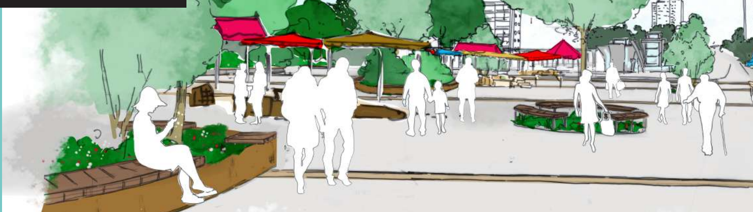
Vue de la place Jean Normand depuis le Conservatoire