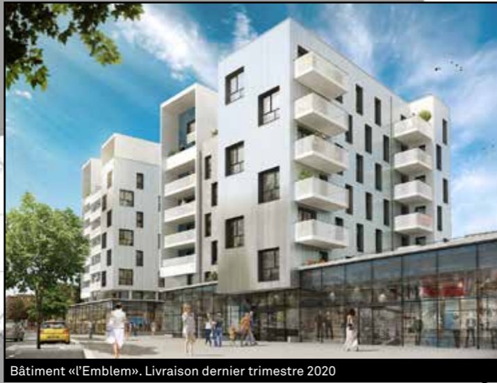
Bâtiment «l'Emblem». Livraison dernier trimestre 2020