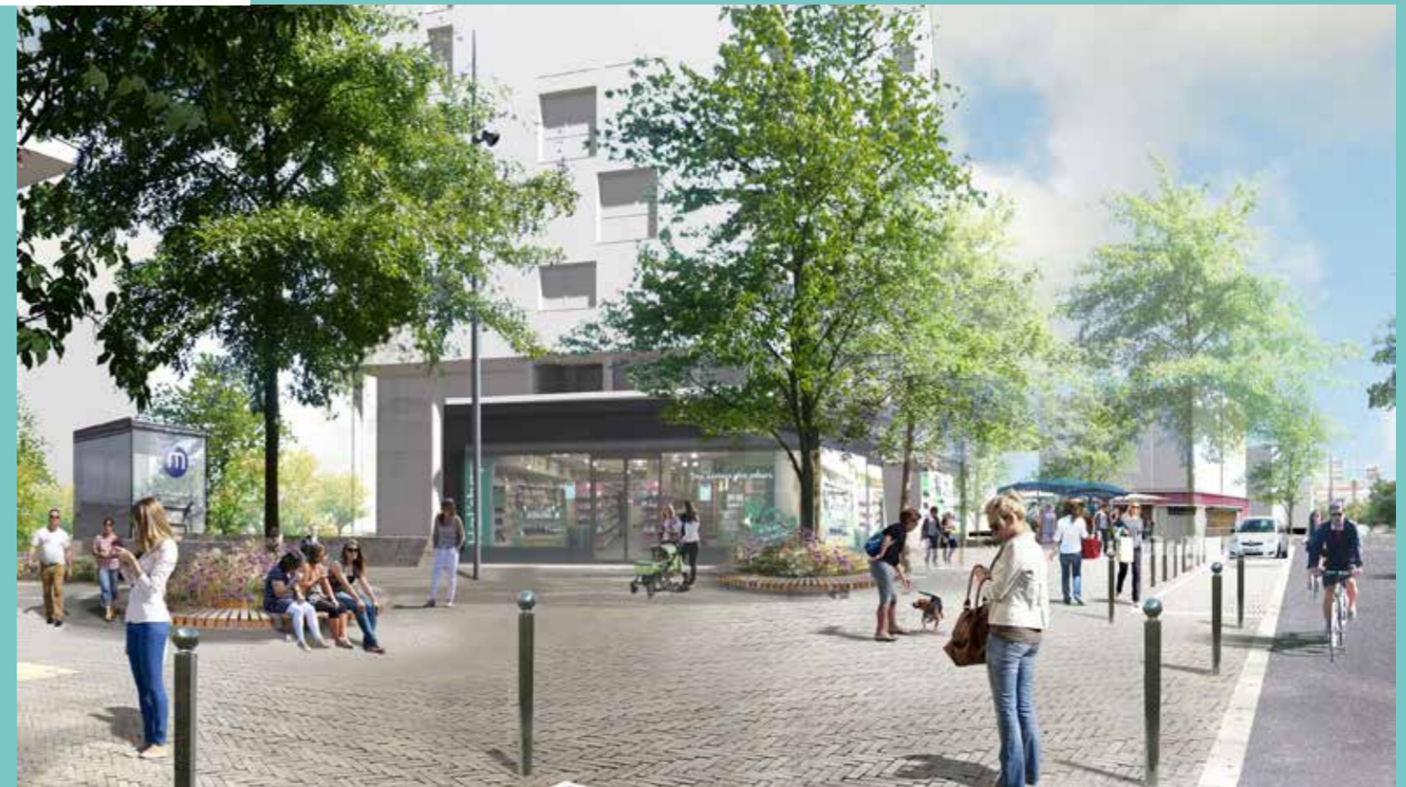
Parvis rue Jules Lallemand

La Ville de Rennes et Rennes Métropole vont aménager les espaces publics autour de la future station de métro Cleunay à partir de la mi-mars. Ce projet s'inscrit dans un quartier en pleine mutation avec la rénovation et la construction de plusieurs immeubles d'habitation et l'arrivée de la ligne b de métro fin 2020.