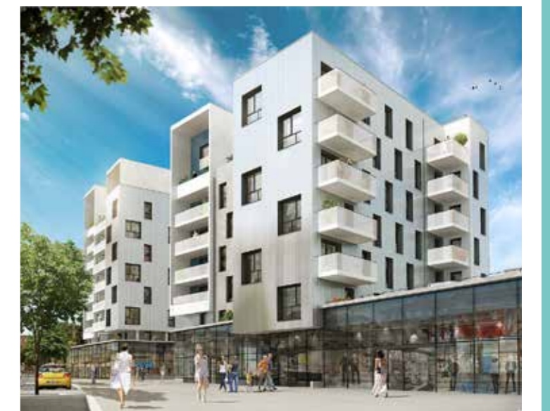
Bâtiment «l'Emblem». Livraison dernier trimestre 2020.

L'intermodalité des transports sera facilitée par la proximité entre les arrêts de bus rue Ferdinand de Lesseps et l'entrée ouest du métro.