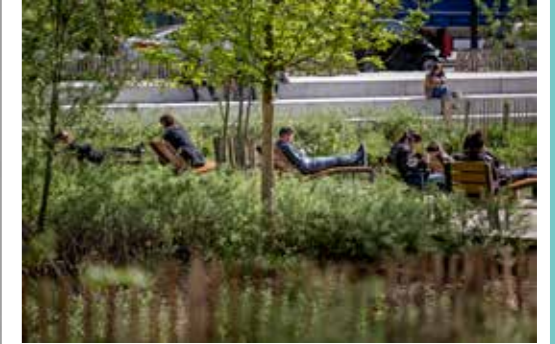
Exemple de mobilier urbain et de loisirs présents dans le futur Square des Oliviers